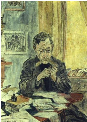
James Ensor, Emile Verhaeren scherpt zijn potlood (1890)